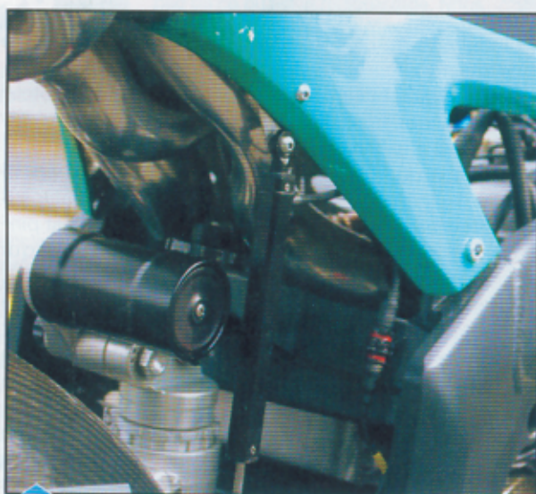
Le travail réalisé par Micron est remarquable tant l'espace dédié à l'échappement est restreint. Très bien étudiée, la ligne en titane se trouve pincée en certains endroits pour une meilleure circulation des gaz. Initialement prévue avec une longueur de 2,50 mètres, elle s'installe dans la partie arrière du cadre. Les collecteurs sont situés juste derrière la poutre centrale du châssis.