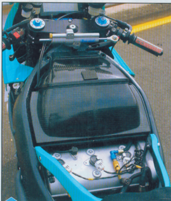
Positionné vers l'arrière, le moteur offre une place importante et un grand volume à la boîte à air.